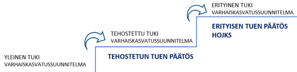
Kuvio 1. Tuen portaat varhaiskasvatuksessa.