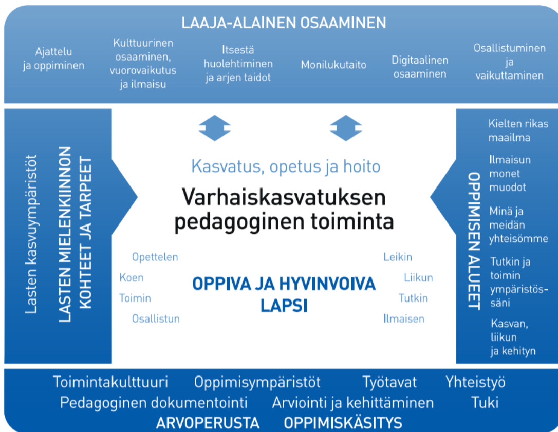
Kuvio 1. Varhaiskasvatuksen pedagogisen toiminnan viitekehys

Varhaiskasvatuksen pedagogista toimintaa ja sen toteuttamista kuvaa kokonaisvaltaisuus. Tavoitteena on edistää lasten oppimista ja hyvinvointia sekä laaja-alaista osaamista (kuvio 1). Pedagoginen toiminta toteutuu lasten ja henkilöstön välisessä vuorovaikutuksessa ja yhteisessä toiminnassa. Lasten omaehtoinen, henkilöstön ja lasten yhdessä ideoima sekä henkilöstön suunnittelema toiminta täydentävät toisiaan. Varhaiskasvatuksen pedagoginen toiminta läpäisee kasvatuksen, opetuksen ja hoidon kokonaisuuden.